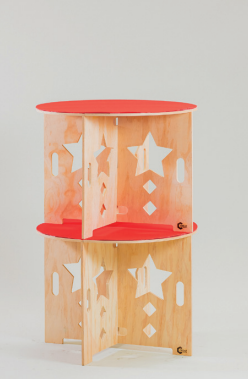
▲展開例 カラーマット等ご要望にお応えできます。