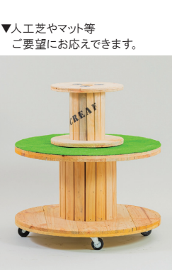
▼人工芝やマット等 ご要望にお応えできます。