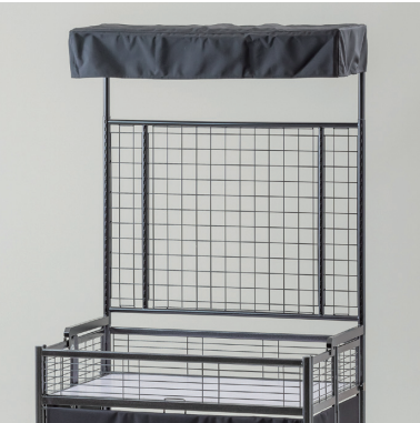
ユーティリティ中折れワゴンパーツ W900×D370×H990 [95005S]