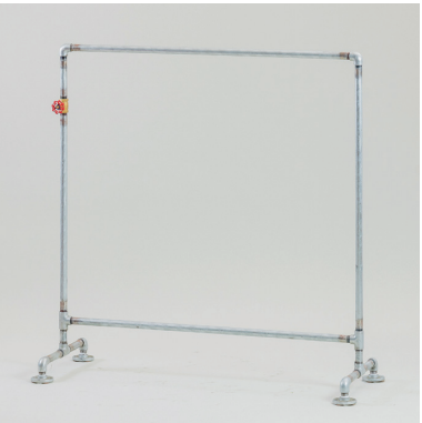
水道管シングルハンガーラック W1200×D500×H1230 [95001S]