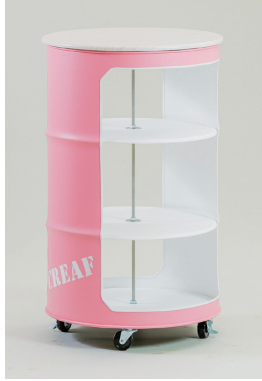
ドラムハイカウンター（可動タイプ） φ600×H950 [ピンク80041、アンティークブルー80054、イエロー80055]