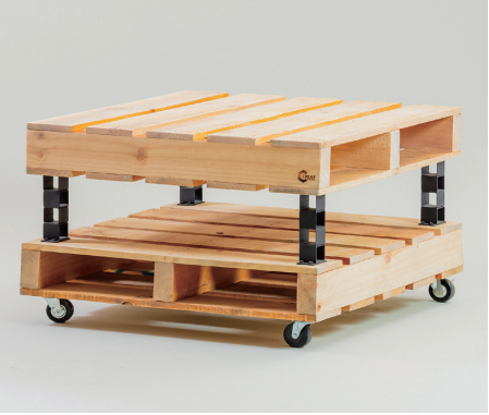
パレット什器二段 W900×D900×H620 [95002S]