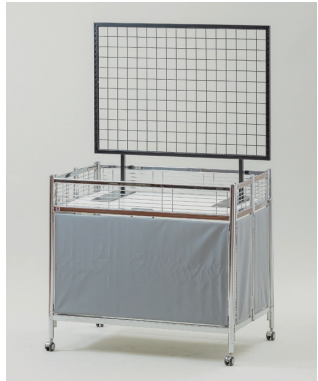
▲ワゴンとの組み合わせ例