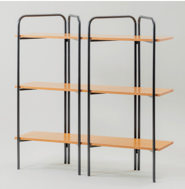
フールド DP W1500×D400×H1500 [95004S]