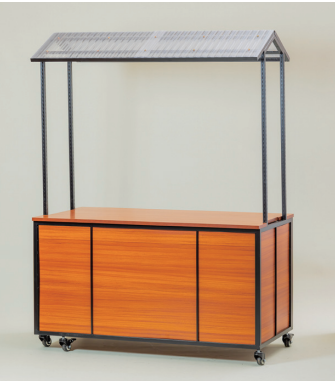
屋台ワゴン（波板屋根） W1500×D800×H2000 [95008S]

◀前面板は黒板と木目のリバーシブル。 黒板面はチョークでPOPなどを書き込めます。 裏側は棚付きでストックが可能。