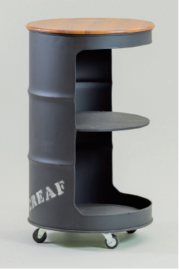
ドラムハイカウンター（通常タイプ） φ600×H950 [マットブラック80050、ピンテージグリーン80040、イエロー80044、別注カラー80045]