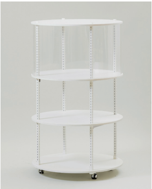
円柱アクリルケース φ900×H1500 [95006S]