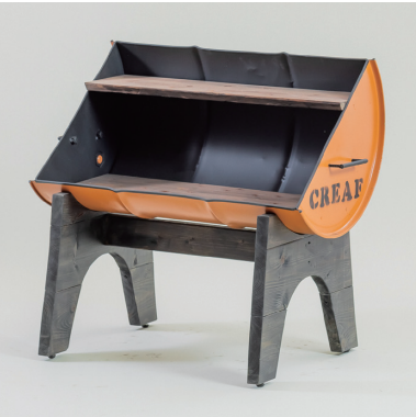
ドラムテーブル B（傾斜タイプ）棚二段 大: W900×D600×H800 [80075]