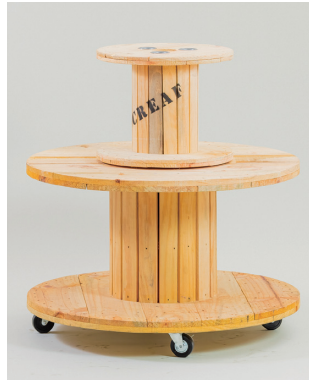
木製ドラム（クリア） 大: φ900×H560キャスター込 [80121] 小: φ450×H350 [80131]