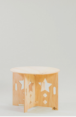
円テーブル星 φ800×H400[80140] φ800×H600[80150]