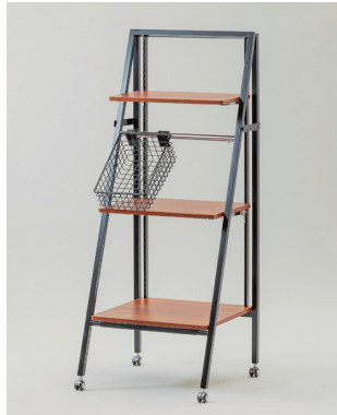
▲バスケット取付例

●ご注意 カタログ記載商品は、在庫が限られている ものもあるため、商品によっては受注生産 となります。