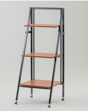
ステップラダーシェルフ W600×D570×H1500 [95003S]