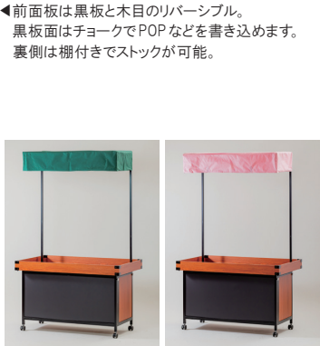
▲テントはグリーン、ピンクあり。 別途作成対応可能。