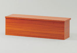
ヨーカン棒 折りたたみ式（ブラウン） W1010×D300×H300 [95011S]

◀前面板は黒板と木目のリバーシブル。 黒板面はチョークでPOPなどを書き込めます。 裏側は棚付きでストックが可能。