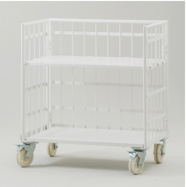
DP 台車 W1010×D600×H1100 [95009S]