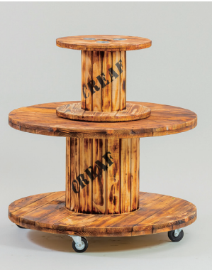
木製ドラム（ベイク） 大: φ900×H560キャスター込 [80120] 小: φ450×H350 [80130]