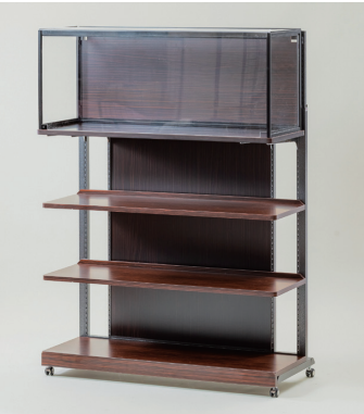
アクリルケース開閉式・黒檀 W1200×D450×H500 [72820]