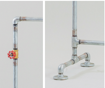
▲水道管をリメイクしたハンガーラック