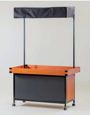
マーケットスタンド W1200×D750×H2000 [80090]