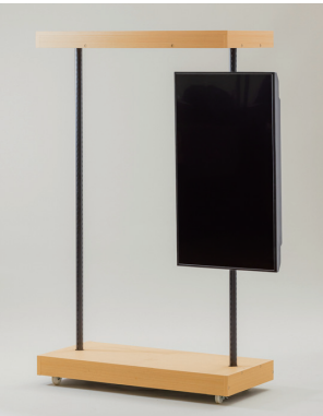
デザラック W1100×D500×H1800 [95010S]