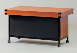
▲テント部は取り外し可能。 天板はリバーシブル利用できます。